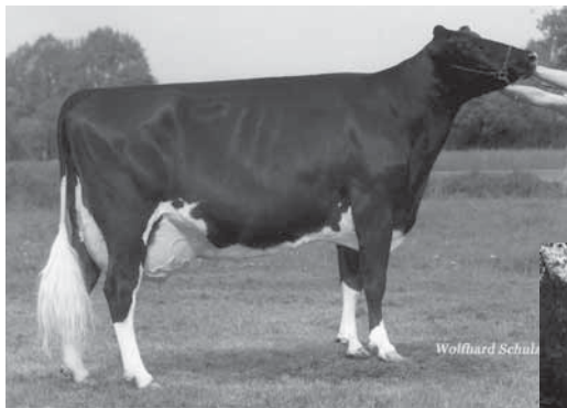
Meggilee EX 91 von Lee, Halbschwester zu FLH Mercedes